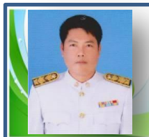
บรรจบ สิงห์ ผ.ร.