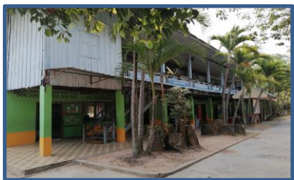
โรงเรียนสะอาด รมรื่น น่าอยู่ น่าดู น่าเรียน