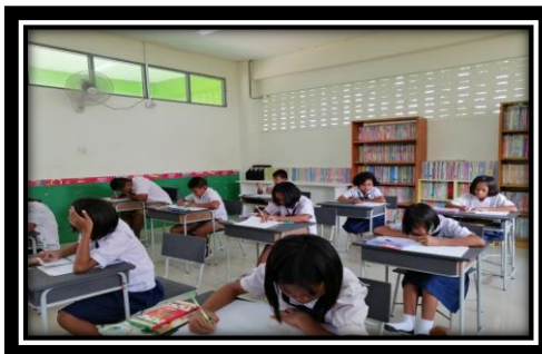
เรียนรู้อย่างมีความสุข สนุกกับการทำงาน

6) ส่งเสริมให้ครู บุคลากร และนักเรียนมีความรักและศรัทธาในสถานศึกษา หลอมรวมให้เป็นหนึ่ง มีหัวใจทุ่มเทเพื่อการศึกษาของชาติ