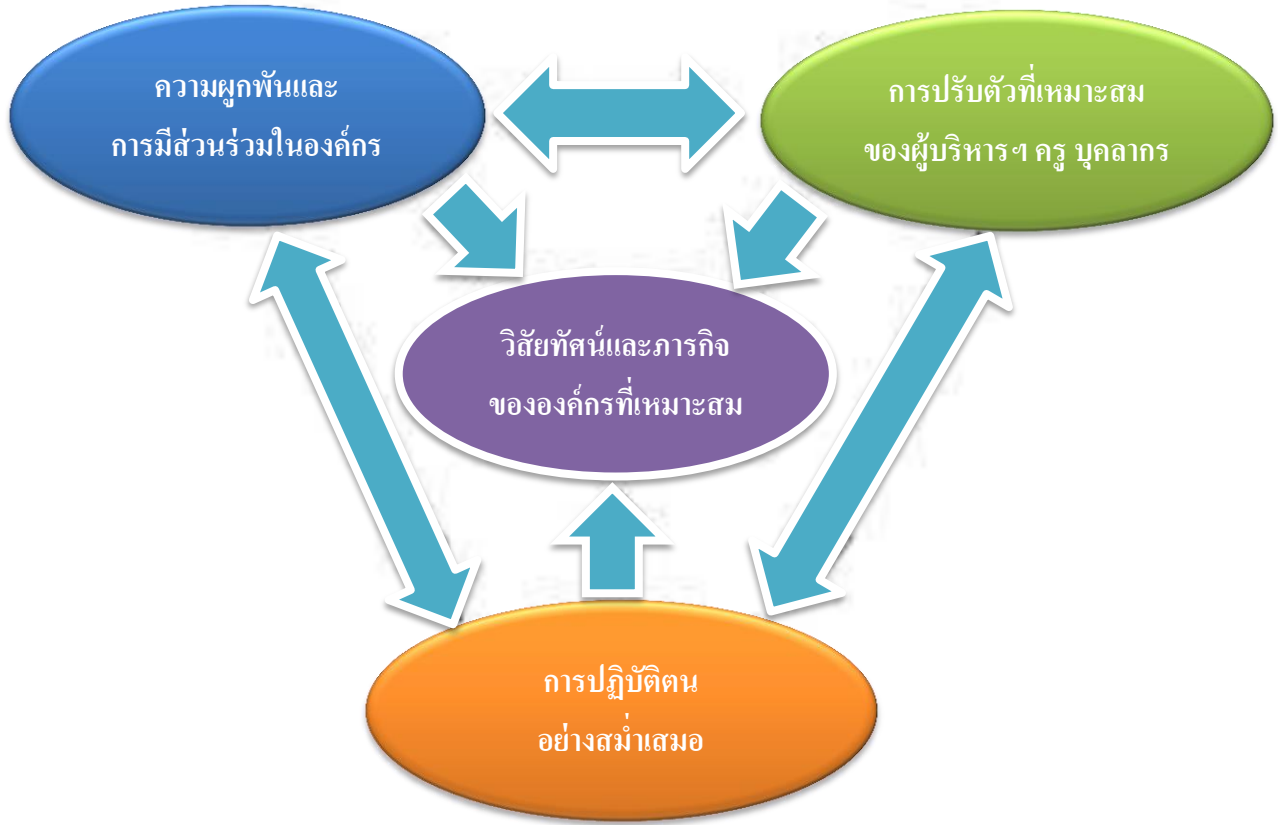
รูปภาพแสดงวัฒนธรรมองค์กรที่ทำให้องค์กรประสบความสำเร็จ

ปัจจัยทั้ง 4 ประการนี้ ส่งผลอย่างยิ่งต่อการพัฒนาองค์กร หน่วยงาน สถานศึกษา ให้บรรลุผลสำเร็จตามเป้าหมาย (Effectiveness) ตามที่ต้องการ ปัจจัยในด้านวัฒนธรรมองค์กรจึงมีความสำคัญสำหรับการบริหารจัดการที่ช่วยส่งเสริม สนับสนุนวิสัยทัศน์ของสถานศึกษาให้ประสบความสำเร็จในองค์กรได้ ดังแผนภูมิต่อไปนี้