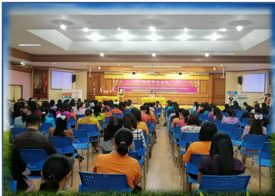
โรงเรียนบ้านโฮ เข้ารับการอบรมการเฝ้าระวังและควบคุมการแพร่ระบาดของ โรคติดต่อในสถานศึกษา ณ หอประชุม OTOP สปจ.ศรีสะเกษ