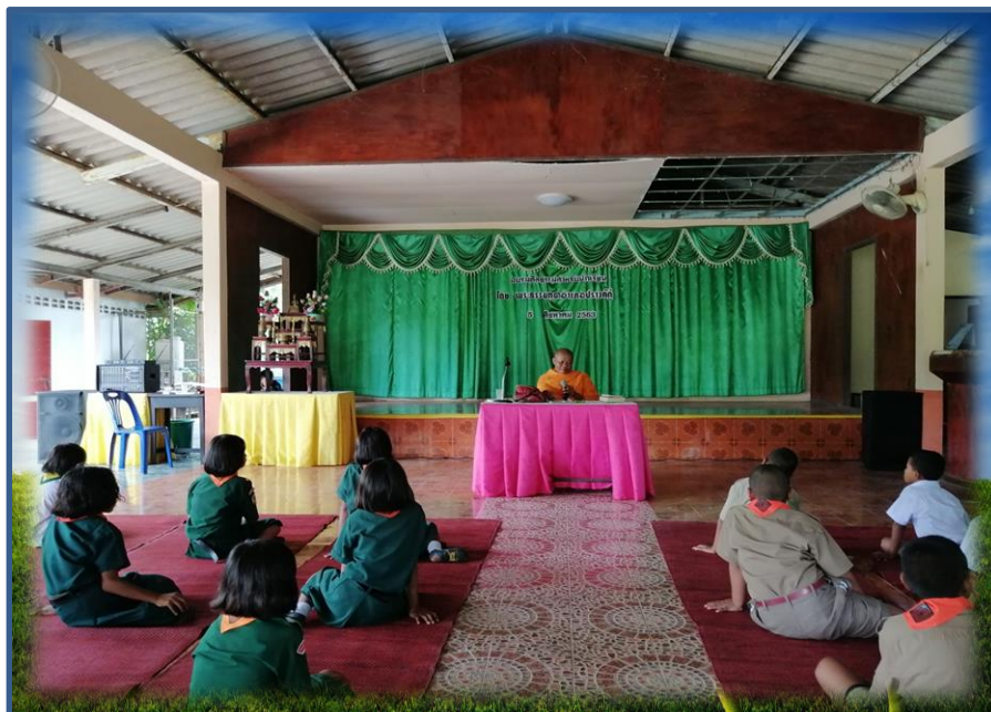
พระธรรมชุต พระพี่เลี้ยง ให้การอบรมคุณธรรมจริยธรรมสำหรับครู บุคลากร และนักเรียน ณ หอประชุมโรงเรียนบ้านโฮ