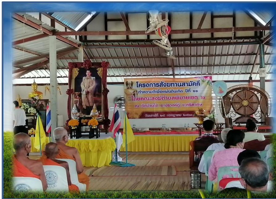
ผู้บริหาร ครู บุคลากร และลูกๆ นักเรียน ร่วมทำบุญสังฆทานสามัคคี ทำความดี เพื่อแผ่นดิน ณ วัดบ้านโฮ ต.พิมายเหนือ อ.ปรางค์กู่ จ.ศรีสะเกษ