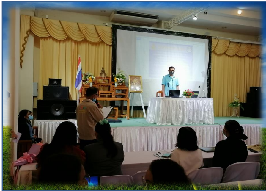
ผู้บริหาร ครูผู้รับผิดชอบโครงการ ครู ICT เข้ารับการอบรมคุณธรรม จริยธรรม และ ความโปร่งใสสถานศึกษา (ITA Online) โดย สพป.ศรีสะเกษ เขต 3